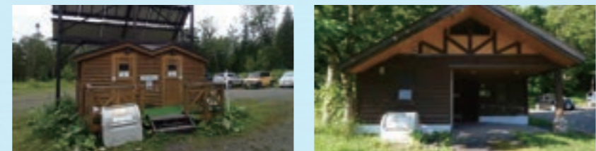
回収ボックスは各登山口や小屋近辺にあります。※地域によって異なります。 You will find a collection box at entrances to the mountain path or near the mountain hut. *The location is different depending on the park.