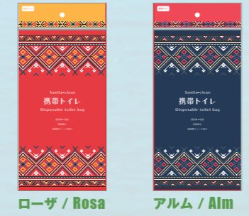
ECOサニタクリーン便袋1枚 / 高密度チャック袋 水溶性ポケットティッシュ1個 ECO Sanita-clean toilet bag (1 piece) / Highly-sealable zip bag Water-soluble pocket tissue (1 packet)

Cute packaging that encourages people to want to put one in their backpacks!